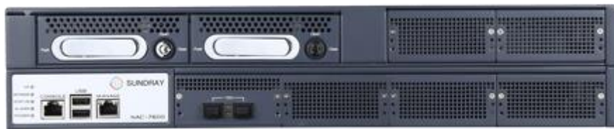
信锐下一代网络控制器

配合信锐无线 AP 和安视系列交换机系列，定位于中型 WLAN 接入业务，如：企业、商超连锁、校园、酒店、医院、政府、金融、景区等高速的 Wi-Fi 应用场景。