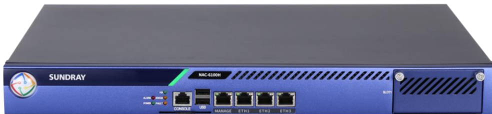
信锐新一代网络控制器

配合信锐无线 AP 和安视系列交换机系列，定位于中型 WLAN 接入业务，如：企业、商超连锁、校园、酒店、医院、政府、金融、景区等高速的 Wi-Fi 应用场景。