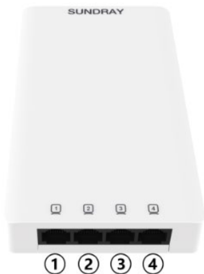
图 1-1 产品正面图

侧面：1 个 10/100/1000Base-T 以太网 Pass Through 端口；1 个 reset 复位孔。