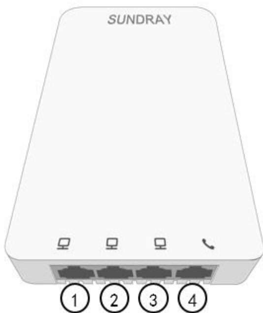
图 1-1 产品正面图

正面：4 个 10/100Base-T 以太网口（其中 1 个以太网口和 1 个 RJ11 口复用）