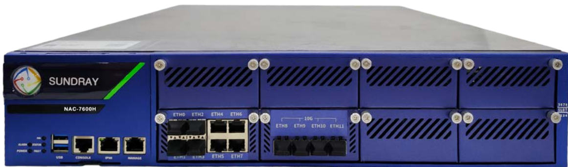
信锐下一代网络控制器

配合信锐无线 AP 和安视系列交换机系列，定位于中型 WLAN 接入业务，如：企业、商超连锁、校园、酒店、医院、政府、金融、景区等高速的 Wi-Fi 应用场景。